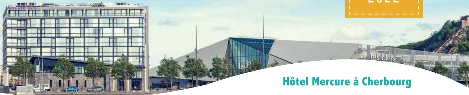
Hôtel Mercure à Cherbourg