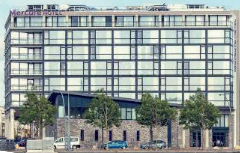
Hôtel Mercure à Cherbourg